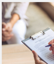
Projet individualisé de soins

Un processus de rétablissement qui passe par la réhabilitation psychosociale